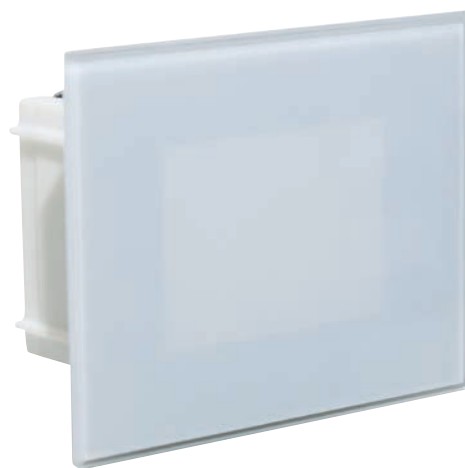
39.9PL5003WCFN Luce Indiretta