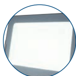
Vetro temperato IK07 Antiabbagliamento