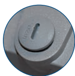
Valvola per la fuoriuscita della condensa

Range tensione di alimentazione da 180V~ a 265V~