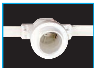
Particolare portalampade attacco E27 con guarnizione