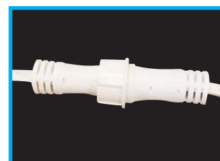
Particolare Prolunga cavo alimentazione Spina a 2 pin ad innesto rapido