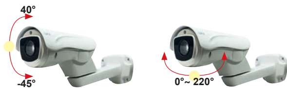
Angolo di rotazione Tilt