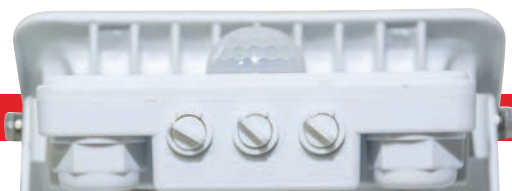
Particolare regolatori Sensore