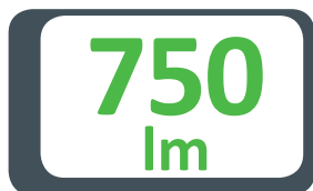
GRAFICO DIFFUSIONE LUCE