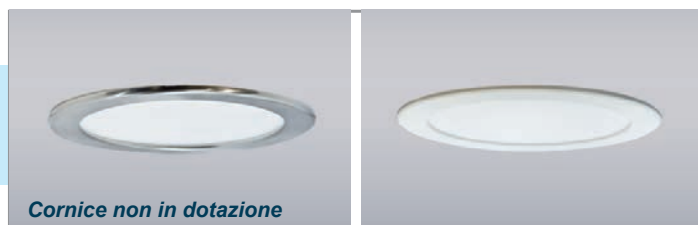
Cornice non in dotazione

Montaggio ad INCASSO con e senza cornice