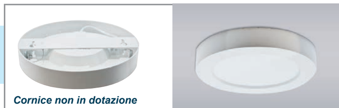
Cornice non in dotazione