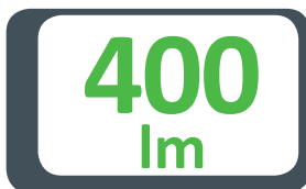
GRAFICO DIFFUSIONE LUCE