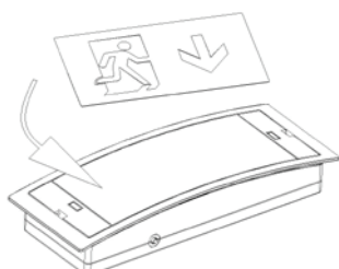
Opzione adesivo integrato